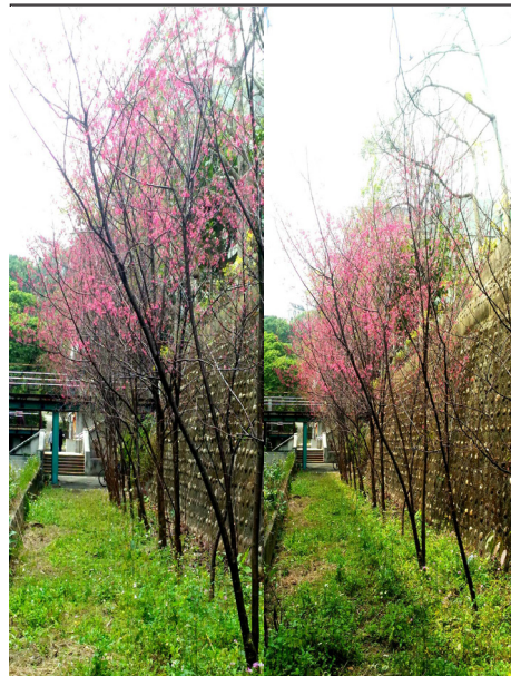
影山樓通往健身房樓梯邊，約有十株盛開的櫻花 攝影：陳郁淇

位於后里區泰安派出所旁的泰安櫻花祭，抵達前沿途蜿蜒的山路旁，隱約就已出現山櫻花佇立於兩側，途中也有整排落羽松步道，及結有桃子的大片桃花，彷彿來到了世外桃源。種植於派出所旁的櫻花步道，雖然只延續了大約兩百公尺，但整列桃紅色的八重櫻，約略六十幾株密集的種植，使步道即使簡短也能凸顯出櫻花全盛期的美景，桃紅色的櫻花環繞著四周，絕對是拍照的好景點。如果想看淡色的粉紅櫻花河津櫻，可以來到新竹市玻璃藝術館旁公園欣賞。不同於桃紅色櫻花來的鮮紅，而是帶有淨白的淺粉紅色。新竹公園櫻花原本為日本人贈送的少數品種河津櫻，但經研究團隊研發利用台灣山櫻花嫁接河津櫻。今年出現全世界唯一品種變種櫻，一株盛開高達六十多朵高密度的粉紅花瓣。不只白天能欣賞，晚上也有燈光照射夜櫻，拍攝起來更有獨特的風味，非常值得前往觀看。因為交通不便或不想走遠也無妨，聯合二坪校區除了門口櫻花外，從男生宿舍影山樓通往健身房樓梯邊，就能看到整排高聳的櫻花。再往樓梯走下右方桌球室及停車場，一側約有五株盛開的櫻花，花瓣顏色比桃紅色深更為鮮艷。找個機會放鬆心靈，不必走遠，在聯大就能親眼目睹櫻花的風采。