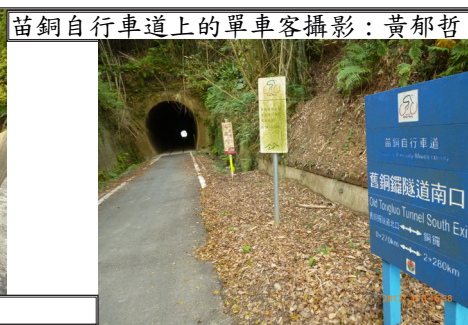
苗銅自行車道上的單車客