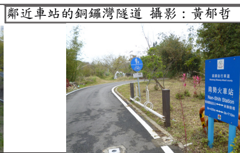
鄰近車站的銅鑼灣隧道