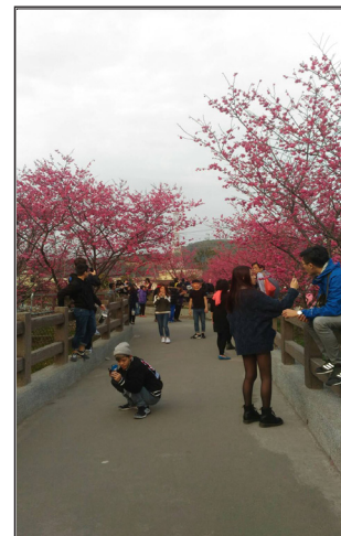
泰安八重櫻，桃紅花瓣吸引許多人前往