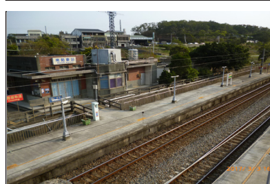
從南勢車站北上便是苗栗車站