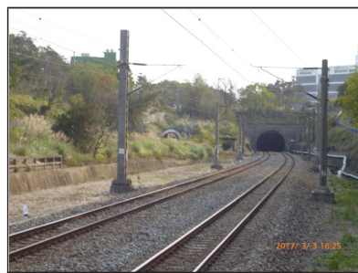
可由自行車道前往南勢火車站