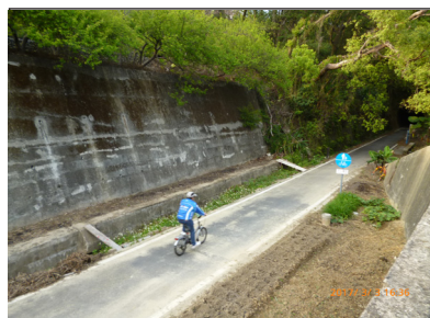
舊銅鑼隧道南口處

葉同學也向記者推測，也許是因為南勢火車站的售票口長期被鐵門關著，常常會被過客誤以為這個車站已經荒廢、未再使用了，因此不會有多少人跑來這裡搭火車，更不會有人知道這裡的自行車步道。確實也是因為沒有臺鐵人員駐守在此售票，造成來這裡搭車的民眾寥寥無幾。即使如此，南勢車站旁也有架設自動售票機以及 IC 卡感應機可供使用，所以大可不必擔心買不到車票。您也想來一睹從未發覺到的苗栗丰采嗎？或想騎著單車徜徉在大自然的懷抱中嗎？還是，您想尋找一些鮮為人知的車站祕境？那還等什麼呢？就讓我們享受一趟「南勢自行車之旅」吧！