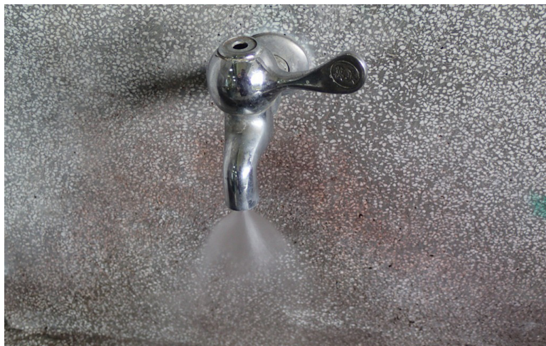
苗縣水情嚴峻 呼籲大眾節約用水

這裡還有當多節約用水個小撇步提供分外宿個同學們做參考，例如將洗衣機固定水量，亦係裝寶特瓶在馬桶肚，做得減少馬桶出水量，也做得在水槽擺細臉盆接一些洗手水，用來沖馬桶、洗廁等等，夏天愛到了亦做得拿去擦地板，按樣較涼爽相對個做得省一些冷氣費，以上方法不但做得省水還做得減少支出，外宿同學不妨馬上來試試。