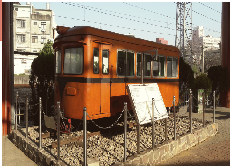
糖鐵巡道、公務車

漫步在苗栗鐵道文物展示館，身旁還會有列車行駛呼嘯過鐵道個聲音及景象，將會有穿梭古今個情韻，係適合遊客悠遊閒走個好風景。