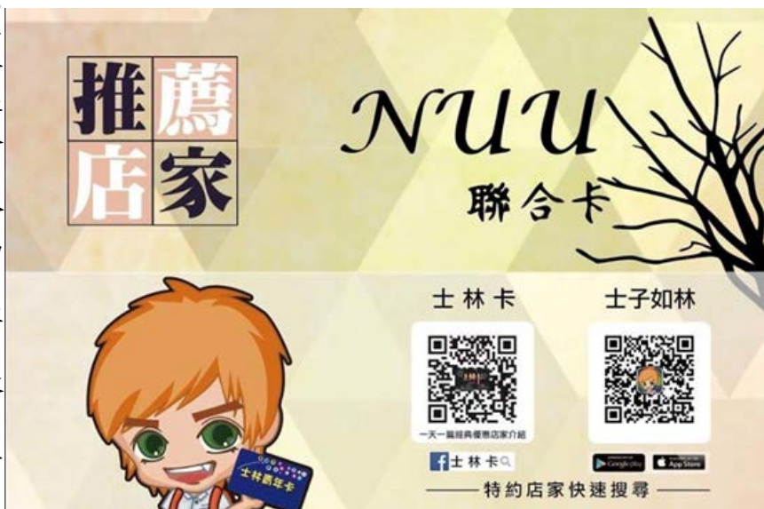
「NUU 聯合卡」

如果還有疑惑也請到「特約 X 聯合 NUU」的臉書粉絲專頁為你解答。主辦單位也提醒，特約卡數量有限售為止！