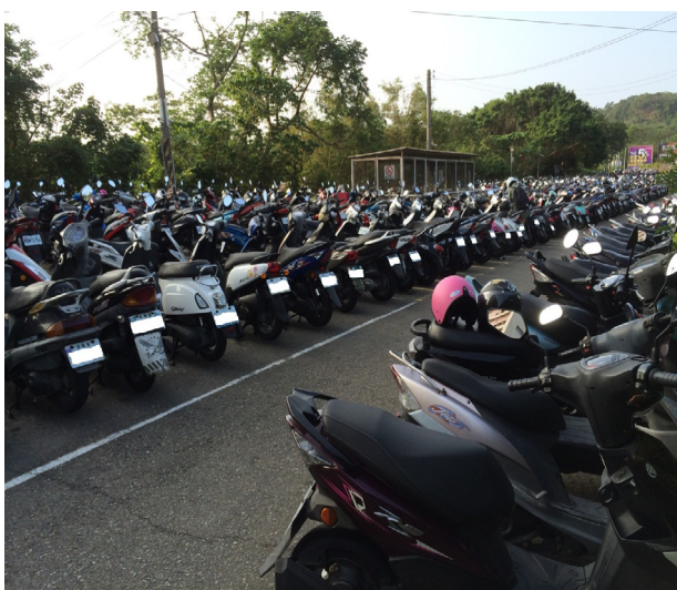
未來未貼停車證者，將不能停在學校停車場。

針對停車證申請事件，學生反彈的聲音極大，校方是否舉辦座談會，和學生面對面理性討論解決之道，是眾多機車族的學生的心聲。停車證申請至今，尚未發放，停車證的成效有待時間的考驗。