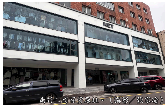
南苗三商百貨原址。

南苗地區的沒落不僅是地方經濟發展趨勢的縮影，也反映出台灣許多中小城市在娛樂產業發展上的困境。然而，只要政府與業者能夠找到適合的策略，並重新打造符合現代年輕人需求的娛樂環境，南苗地區仍有機會再現往日榮景。