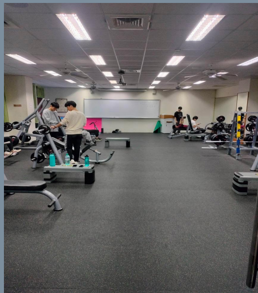
段間，聯大健身房因使用人數過多，導致空間擁擠、器材供不應求，同學盼增開時段改善現狀。

由於校內健身房的擁擠問題已經影響到許多學生的運動計畫，如何有效管理健身房的開放時間與使用規範，成為學生與校方需要共同面對的課題。學生希望能夠透過增加開放時段、擴充設備、或是採取預約制等方式改善現狀，而校方則需要更進一步檢討現有政策，確保學生能夠充分利用校內資源，維持健康的運動習慣。希望未來學校能夠聽取學生意見，提供更完善的健身環境，讓學生在忙碌的學習生活中，仍能享受運動的樂趣，達到身心平衡的效果。