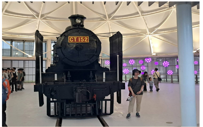
▲民眾爭相與 CT152 號蒸汽火車頭合照。

另一主題區域為主展區，轉車台大廳中展示多輛具特殊紀念價值的珍貴火車，並融合科技與客家文化元素，讓遊客沉浸於實體火車與客家文化的藝術場域，除此之外還在列車展示館中展出台灣鐵道發展歷史上的各式火車，介紹其背景與特色，展示館旁的投煤練習場則提供遊客體驗早期蒸汽火車的投煤技術，感受鐵道文化的特殊魅力，另有文物故事館，展示鐵道相關文物，講述其背後的故事與歷史意義。