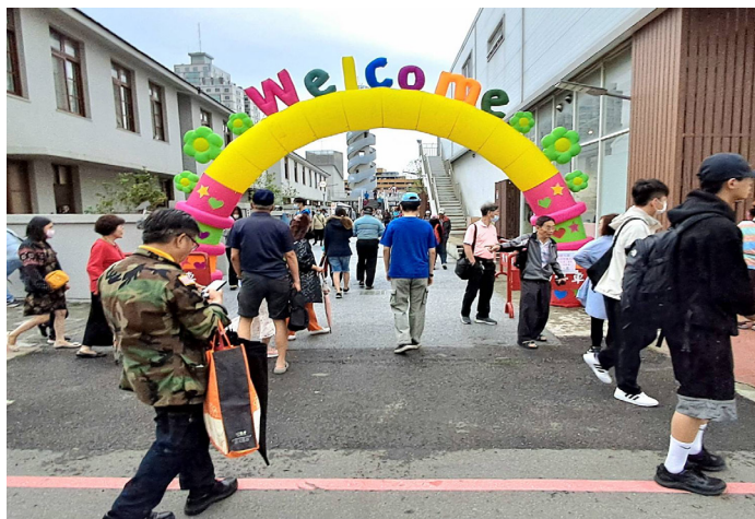
▲苗栗火車頭園區開幕當天陰雨綿綿人潮仍絡繹不絕。

園區的核心展品之一為 CT152 號蒸汽火車頭，這輛被譽為「國寶級」的蒸汽機車，現陳列於轉車台大廳，並設有動態轉向展示，園區亦同