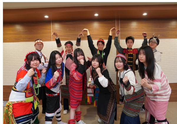
日本學生穿族服的大合照。

這次與日本高專師生的交流，不僅拉近了雙方學校的距離，也讓台灣原住民族文化透過親身體驗的方式，被更多國際友人看見。聯合大學未來也將持續推動多元文化交流，透過實地互動，培養學生的全球視野與跨文化能力，並在國際交流中展現文化自信，成為台灣原住民族文化的重要推廣者。