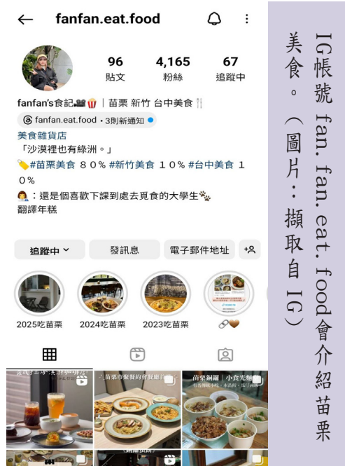
IG 帳號 fan.fan.eat.food 會介紹苗栗美食。