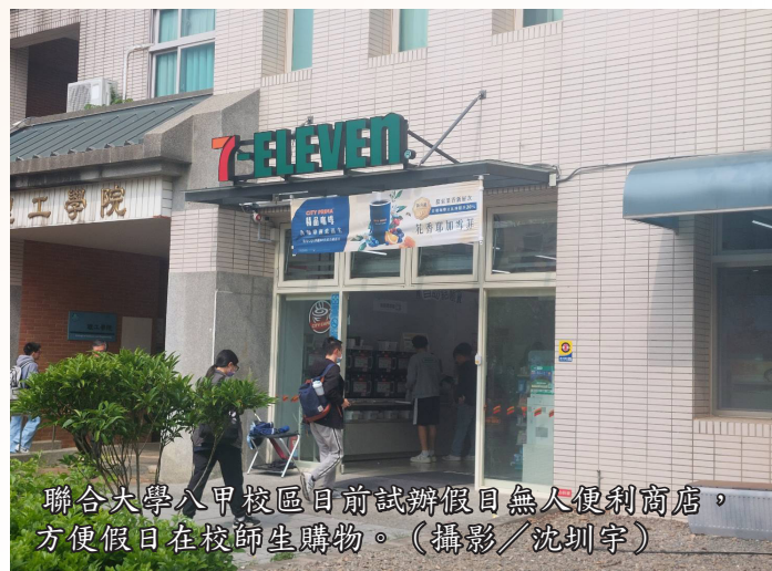
聯合大學八甲校區日前試辦假日無人便利商店，方便假日在校師生購物。

對於無人便利商店的開設，學生反應不一。資工系李姓同學認為，無人商店雖然提供便利，但由於缺乏即時服務與熱食選擇，仍是一大缺憾。也有語傳系陳姓同學對於無人模式的創新表示肯定，認為這能減少購物排隊時間，並提升購物體驗。