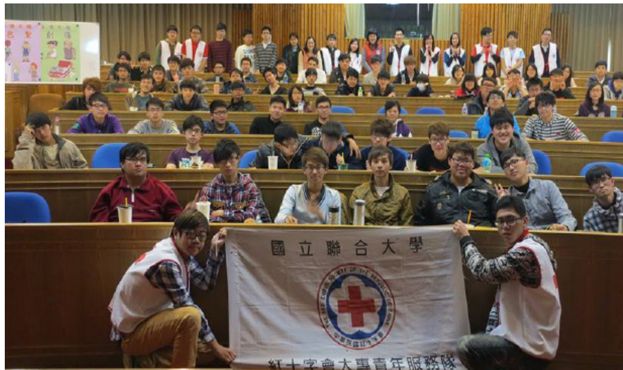
▲本學期第一次急救班課程結束後，全體參與者與工作人員大合照，5 月 17 日將辦理本學期第二次的急救訓練課程。