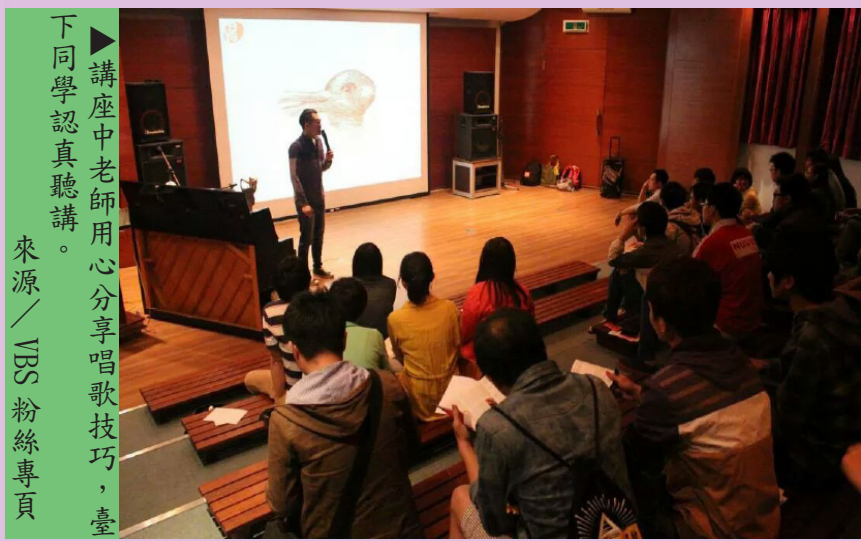
講座中老師用心分享唱歌技巧，台下同學認真聽講。

VBS 主要是幫學員優化嗓音矯正發聲的方法及位置，VBS 透過免費的巡迴演講回饋學生也順便打廣告，想上課的同學可以透過粉絲專業聯絡他們，而不想花錢上課的同學，VBS 也會不定期的 PO 教學影片和 Q & A 等，提供給同學看！