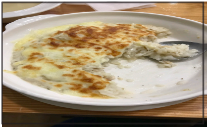
左圖 1、2 為 NUU PASTA 的招牌酥脆麵包佐香蒜醬及燻雞焗烤飯