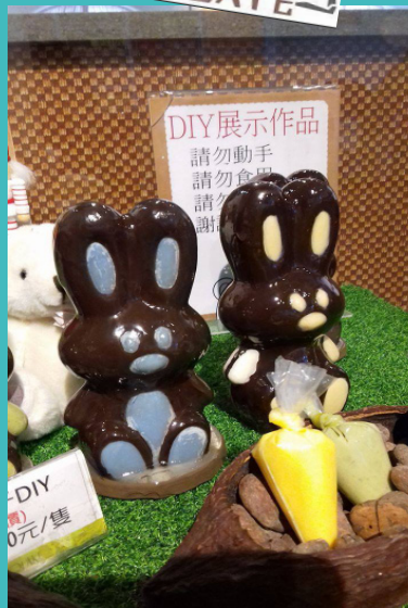
▲DIY 巧克力兔子