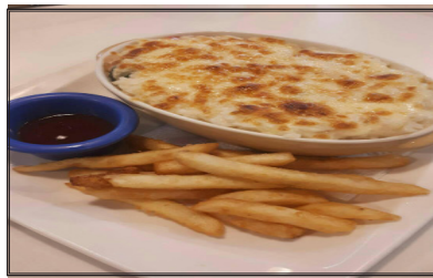
右 1、2 圖為洋津熱銷餐點不膩口鴨賞香辣焗烤飯及白醬蛤蜊義大利麵