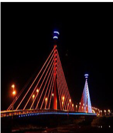
▲夜晚的新東大橋是苗栗的亮點

【記者許育豪、陳嘉章報導】秋天的夜景有多美呢？古人云：「天階夜色涼如水，臥看牽牛織女星」，或許就是最佳的寫照。秋天微風徐徐的夜晚，配上美麗的夜景真是人生的一大享受！在苗栗說到賞夜景大家一定會想到：新東大橋、雙峰山還有桐遊柿界，其中桐油柿界還是間餐廳，讓您大飽眼福之際也能飽餐一頓！學期初的休閒夜晚，不如就揪個三五好友一起出門感受一下秋夜的美吧！