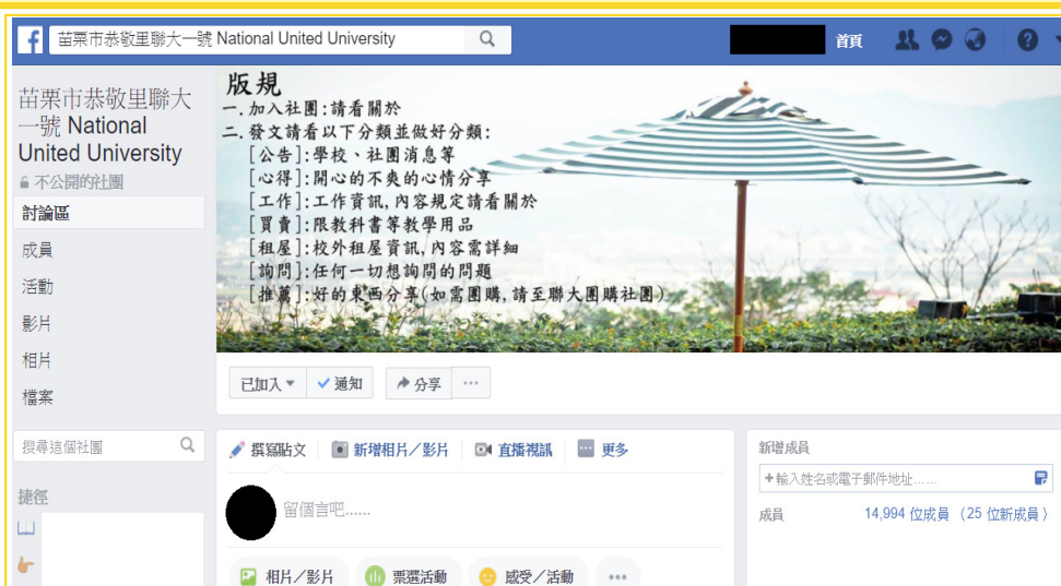
▲ 聯大所有活動資訊，學生都可以從聯大一號上知道不少消息。

會需要行動聯合 APP，在行動 APP 裏頭有許多同學需要的功能，課務管理系統能找到這學期你的課表能幫助同學更清楚瞭解這學期的上課時間和位置，成績管理系統能找到所有關於成績相關的事務，讓同學可以輕鬆的知道自己的學習狀況，在行動聯合 APP 裡也有設置家長入口和教師入口，讓老師和家長都能很容易地瞭解同學們的成績情況，所以對聯大同學們來說行動聯合 APP 是一個相當方便且不可或缺的一個科技工具。