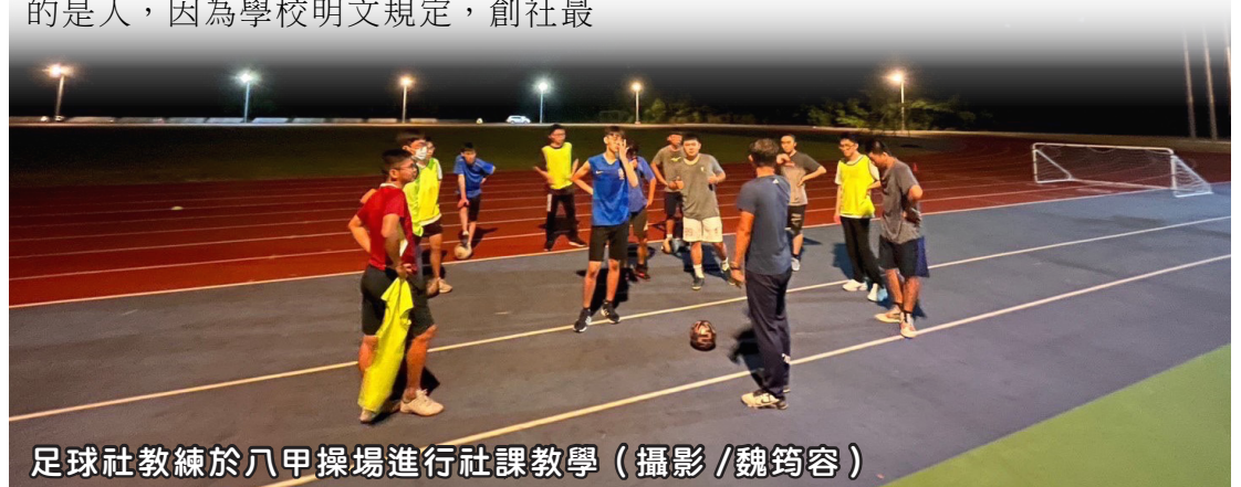
足球社教練於八甲操場進行社課教學

由於是剛創立的社團，足球社缺乏良好的練習場地及足夠的球具，在各方面都資源貧瘠的情況下，有的只剩成員們那一顆顆炙熱的心，但俗話說的好，好事多磨，相信即使是再貧瘠的土地，也終將會有成長茁壯並開出花朵的一天！