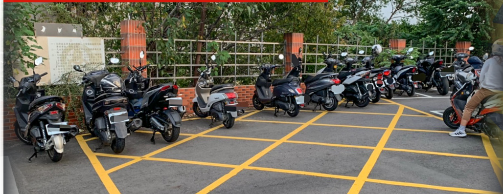
學生將機車違停在黃色網狀線上