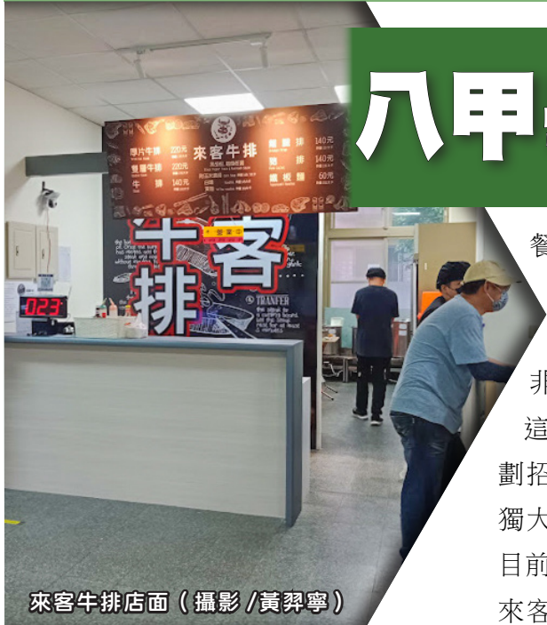
來客牛排店面