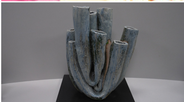
▲李茂宗運用苗栗原鄉陶土創作。

【記者羅國樺／苗栗報導】國立聯合大學舉辦的「李茂宗的陶藝藝術空間」二月二日在八甲校區國鼎圖書館正式開幕，這次展覽的作品是李茂宗為了想回饋家鄉，並振興家鄉的陶瓷產業和發揚家鄉陶瓷藝術，而捐贈於國立聯合大學教學觀摩之用。 李茂宗為台灣苗栗公館人，是台灣現代陶藝開拓者之一，曾獲得「西慕尼黑國際陶藝獎之金牌獎」，是我國首次在國際藝壇上首次獲得這項大獎。其創作的風格隨著年代的不同而轉換出不同形象，在二〇〇〇年代，為現代陶藝的萌芽階段，李茂宗奠定了他日後作品的新面貌。二〇〇〇年代後，定居美國，「陶藝」視野變得更加寬廣。此後開始脫胎換骨，創作一系列如「形隨意破意逐形成」、「得意而忘形」等作品展現出生命和自然對藝術的觸發。 在這次展覽中，幾乎每件的作品都是李茂宗運用苗栗原鄉陶土創作，並在國際上獲獎，其中更是有以二〇〇〇年「自然」系列的作品最受矚目，達到了天人合一的境界。這些作品都是打破傳統陶瓷型態，加入創作者內心的理想與期望，使觀者發覺這不但是陶瓷創作突破，更是融入個人主義的立體藝術。