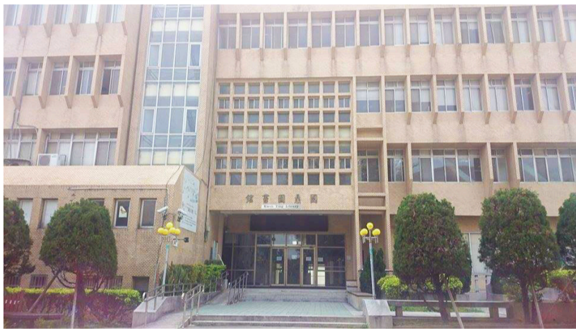
▲二坪圖書館遷至立德一樓 原址將改建成男宿。