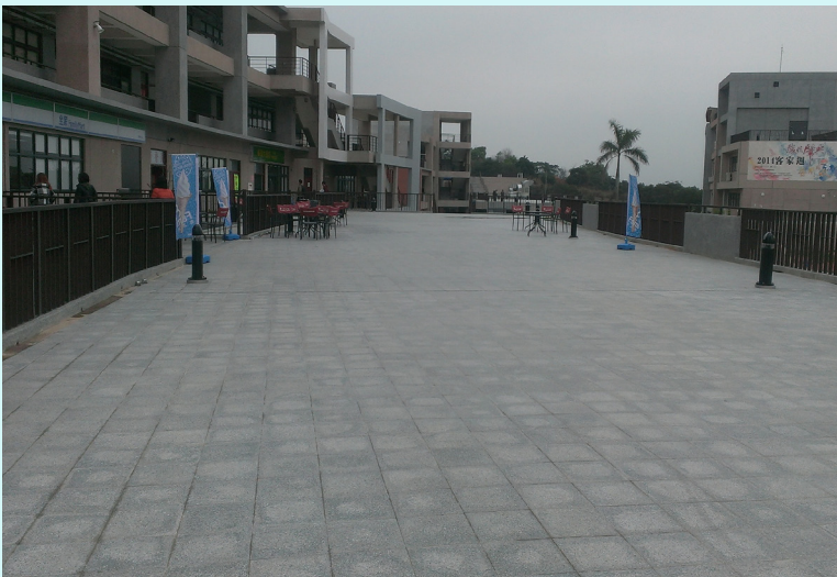
▲八甲校區全家前廣場，未來可用於小型活動場地，讓學生可以自由使用。