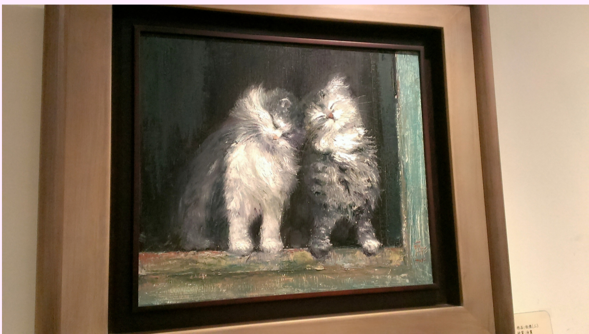
▲謝宛彤油畫作品 - 依偎 (二) 運用筆觸以及顏色的疊合，表現出貓毛的柔軟以及立體感。

【記者徐郡旋報導】繪畫才女謝宛彤即日起至10月22日在聯合大學蓮荷藝文中心展出她的繪畫作品。此次展覽主要展出謝宛彤老師的油畫及水彩作品，作品多為肖像畫及人體描繪，透過細膩的筆觸及鮮豔的顏色，表現出不同的意境以及美感。她的其中一項作品「依偎（二）」，運用筆觸以及顏色的疊合，表現出貓毛的柔軟以及立體感，刻劃出兩隻貓咪相互依偎的可愛景象。現場還有她的作品小卡可供前來觀畫的民眾索取收藏。 謝宛彤說到，「人。合呼」就是一群人的集合歡呼。這些人指的是畫界的長老及前輩知音，謝宛彤用畫他們畫像的方式，記錄在自己繪畫的作品史上，和其他的作品相互輝映。他們也在謝宛彤作品風格轉變不踏實時，給予肯定和鼓勵。 苗栗美術協會的榮譽理事長劉先生是一位有深厚的美學素養的抽象畫家。而對謝宛彤而言，能得到劉先生的肯定是無比的榮耀和莫大的鼓舞。在2015年的協會聯展，劉老讓出了展場中央一直以來都是資深藝界長老的位置，掛上謝宛彤的作品（遇見知音 油畫50cm），並得到劉老的讚美與肯定，讓謝宛彤受寵若驚，因而蘊釀此次的「人。合呼」個展。 謝宛彤喜歡觀察「人」的表情及動作，而這些其實最常用第一人稱的方式表達。自己的情緒變化、自己的臉部的細微轉變，配合著周遭的環境的人事，內化在人物、畫像的表現上。所以在創作過瓶頸時，謝宛彤會先內省，也就是畫自畫像。謝宛彤表示，畫自己才能碰觸到自己最真實或最具想像力的那個區塊，讓創作長了翅膀飛向未知的境界。招喚美麗的色彩、調皮的筆觸創造未知的意象。 謝宛彤希望能一直創作，持續到最後離開人世的那一天。也希望以遊戲人間的心情，用畫作記錄過往的旅程中所見所聞，消化內化昇華在作品中。「我也在尋找純真的愛，不一定是男女之愛，對環境、對人事物，讓自己付出真愛不求回報，也讓自己遇苦吃苦而樂，從從容容坦蕩蕩走過每一階段，也就自然滋養創作的能量。畫如其人；人如其畫。我一直遵循著。」，這是謝宛彤對自己的期許。