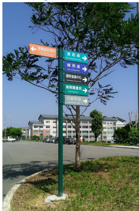
▲八甲校區之標示牌，未來將會增設數根標示牌並做詳細標示。

【記者徐郡旋報導】聯合大學八甲校區教室已於暑假期間大致完工，大部分的系館與行政單位都已搬遷至八甲校區。先前搬上八甲校區上課的同學，對於各系館位置都已熟悉，但對於這學期進駐的部分系館卻是一大難題。由於部分系館系辦和行政單位剛搬上八甲校區，再加上八甲校區地域廣大，同學無法快速找到自己想要的教室或辦公室，造成許多同學開學第一天上八甲辦理事項時，會找不到欲前往之處或系辦，甚至有同學繞了一整個校區才找到自己的目的地。 語傳系邱同學表示，她是第一次上來八甲，因為系辦在比較後方的位置，但卻沒有明顯的標示或指標，僅在騎樓用立牌介紹新大樓的各教室，對八甲新環境不熟悉。 【記者徐郡旋報導】聯合大學八甲校區教室已於暑假期間大致完工，大部分的系館與行政單位都已搬遷至八甲校區。先前搬上八甲校區上課的同學，對於各系館位置都已熟悉，但對於這學期進駐的部分系館卻是一大難題。由於部分系館系辦和行政單位剛搬上八甲校區，再加上八甲校區地域廣大，同學無法快速找到自己想要的教室或辦公室，造成許多同學開學第一天上八甲辦理事項時，會找不到欲前往之處或系辦，甚至有同學繞了一整個校區才找到自己的目的地。