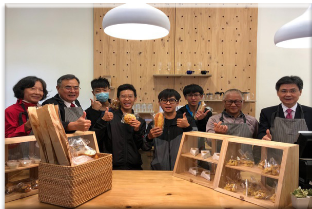
▲聯阿嬤的誠實麵包店開幕，與會師生和貴賓開心合影

接下來進行各學系活潑的進場儀式競賽、升旗典禮以及總錦標傳承儀式。11月28日早上9點30分於第二校區(八甲)校區國際會議中心舉行校慶慶祝大會。11月28有各系友回娘家、11/27-11/28校慶美食街在第一(二坪)校區公強樓、校慶園遊會在第一(二坪)校區操場東南二、三棟間、11月28日下午2時在第一(二坪)校區操場啦啦舞競賽最讓人期盼、11月27日紅柿傳情在第一(二坪)校區、校園內熱鬧滾滾，洋溢著歡樂校慶的氣氛。