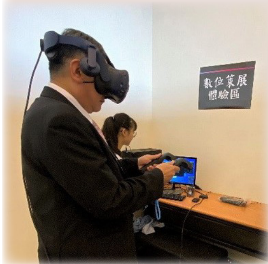
數位策展體驗區。VR展區。

突破：千年客家，長路漫漫！」、知名電台主持人張吟旖演講「客語廣播節目歷史與未來發展」，並有客家纏花、書畫陶藝、紙雕、客家龍脈空拍圖等多項展覽和茶道展演，由學生策劃演唱的「客家小舞台-客家音樂展演」。12月2日閉幕當天則有「客語師資培育」論壇，邀請政府官員、學者和中小學校長教師，共同探討客語師資人才的培育。