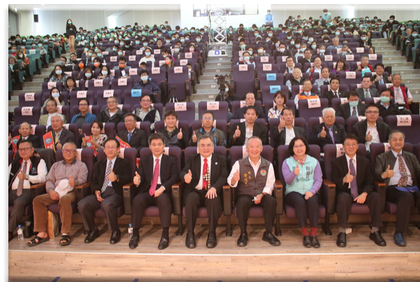
▲全體與會人員合影