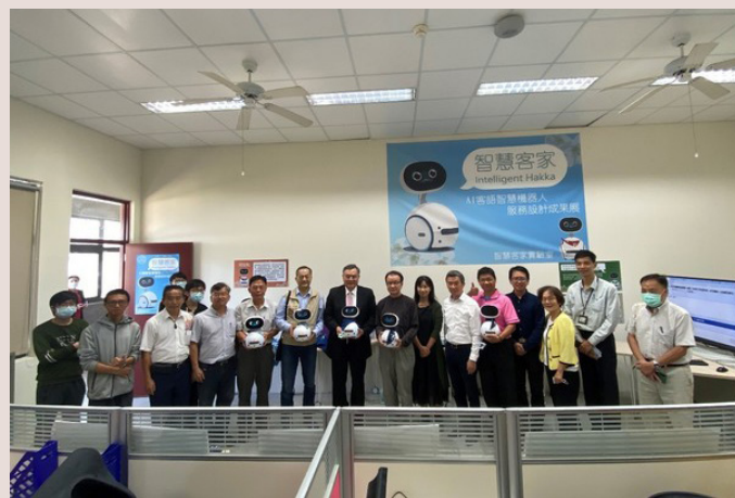
▲109年國立聯合大學客家研究學院第9屆客家週開幕式長官及貴賓合影。

客家週系列活動包括有「愛『拼』正會贏」新書發表，有趣的「客家話英文說」雙語互動比賽、童蒙書客語吟誦表演，還有多項演講，包括「千年客家」作者湯錦台先生演講「傳承與