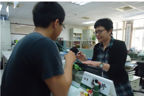
▲學生至課指組詢問申請獎學金之相關事宜

不可申請「優秀學生獎學金」；低收入戶者無法申請「清寒助學金」，且申請此助學金須每學期在系上義務工讀一百小時。此外，校內獎助學金每學期僅可申請一次，無法重複申請。同學可至學務處課外活動指導組網頁查詢相關條件與規定。