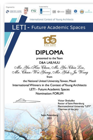
▲俄羅斯LETI競圖首獎獎狀