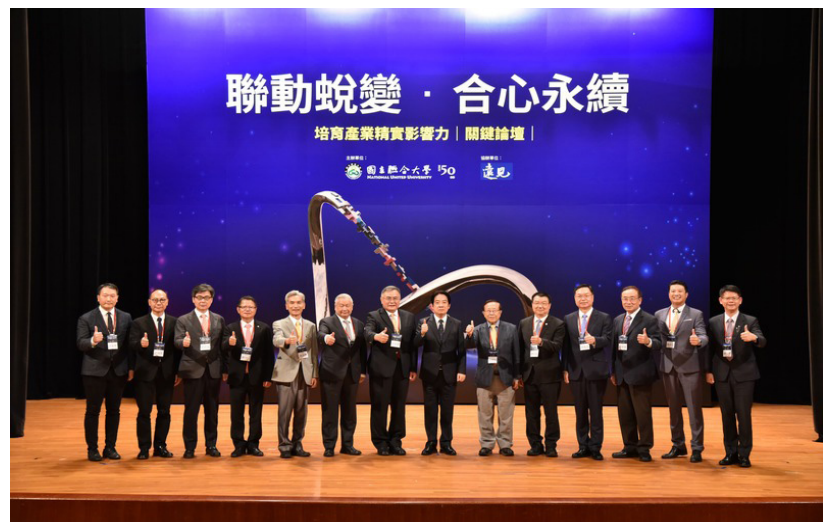
▲賴清德副總統（右 7）、聯大李偉賢校長（左 7）、遠見、天下文化事業群創辦人高希均教授（右 6）和與談貴賓合影

本校李偉賢校長致詞表示，今年適逢學校創校 50 週年，為慶祝這個具有紀念性的節日，並擘劃學校未來校務發展的策略與藍圖，非常榮幸的與遠見雜誌合作，在此舉辦本校 50 週年論壇。誠摯感謝賴副總統的蒞臨指導，增添論壇無限的光彩。同時也竭誠歡迎各位產官學研的嘉賓與會，共襄盛舉，為聯大注入永續發展的新能量。此外，學校是創造新知的重鎮，而新知的價值須能落實於社會與企業的應用。因此透過不同的產學合作模式，務實有效的鏈結，互惠互利創造雙贏，將是學校永續發展的重點之一。我們邀請到了深受各界推崇的傑出校友代表，產業界的菁英及友校的校長們，擔任各個專題的主持人及與談人，相信精彩可期。讓我們以 50 為根基，迎向下一個五十，昂首邁向百年學府的里程碑。