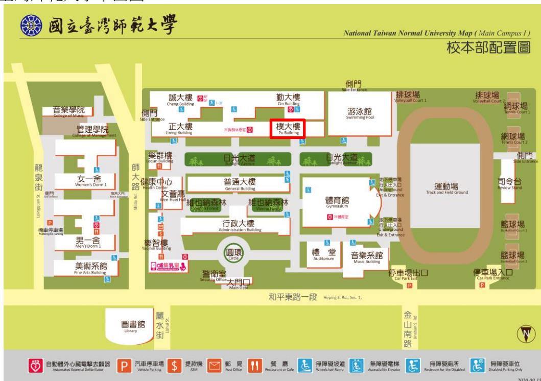
臺灣師範大學平面圖

三、合辦單位：臺灣語文學會、臺灣師範大學地理學系、中央大學客家語文暨社會科學學系、臺中教育大學區域與社會發展學系、臺中教育大學臺灣語文學系、雲林科技大學客家研究中心、高雄師範大學客家文化研究所、臺灣師範大學全球客家文化研究中心