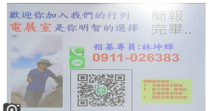
演講最後附上自己的聯絡資訊，給對於有興趣的同學有可以深入了解的管道。

至於人格特質，林坤輝認為不需特別突出能力，「只要能穩定在辦公室工作、願意學習即可。」，對於職場氛圍，林坤輝也坦言，目前制度相較過去更為開放，包括人際互動皆趨於多元。活動最後，他鼓勵有興趣的學生可進一步諮詢報考資訊，並提醒相關報名時程，期望透過說明會讓學生對軍職有更全面理解。