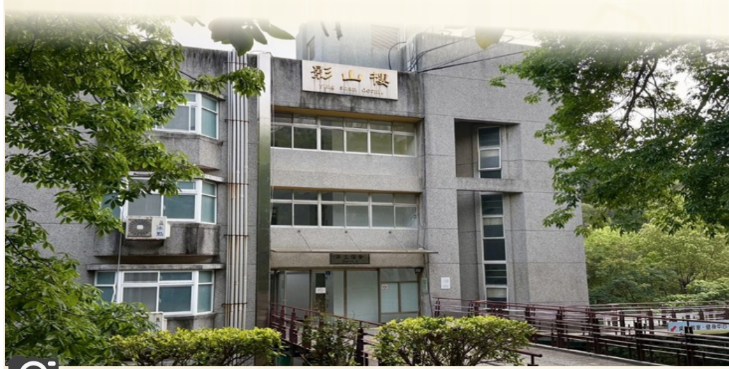
聯合大學二坪校區第三宿舍影山樓。

隨著學生意見逐漸受到重視，第三宿舍設施分配問題已成為校園關注議題之一。校方在收到學生意見後，於 4 月 1 日積極進行改善措施，依據女生宿舍電路安全評估完成牽線作業，並於女生宿舍公共空間設置重建前的臨時過渡設備，包括微波爐與電磁爐，提供住宿生基本使用，以緩解現階段生活上的不便。