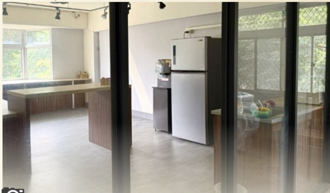
位於影山樓宿舍二樓的共享設施。

除了飲食準備問題外，也有住宿生指出交誼廳原為提供學生交流與休息的重要空間，但因設置於男生樓層，使部分女生住宿生較少使用相關設施，間接影響宿舍內的互動機會。有學生認為，若公共空間能更平均配置，將有助於提升整體住宿品質。