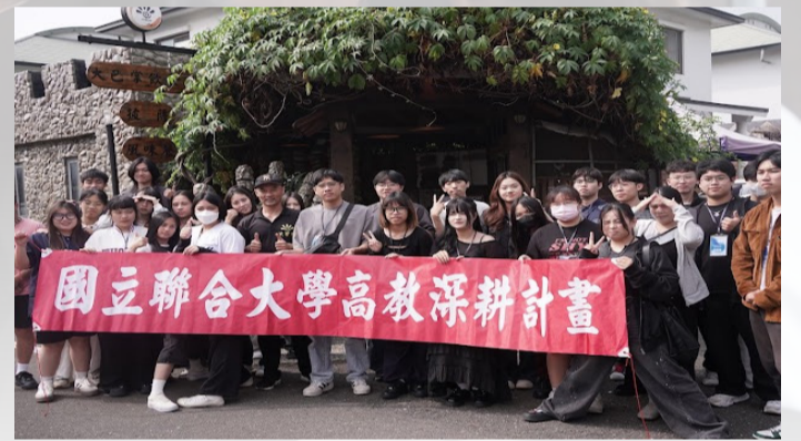
參訪活動合影，展現學生參與校外學習的成果與收穫。

校方表示，透過此次參訪活動，不僅讓學生們接觸不同產業樣貌，也促進對多元文化的理解與反思。未來將持續結合校內外資源，規劃更多具實務性與探索性的活動，協助學生在學期間逐步釐清職涯方向，提升進入職場的競爭力。