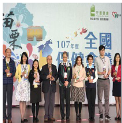
長官及工作人員合影。