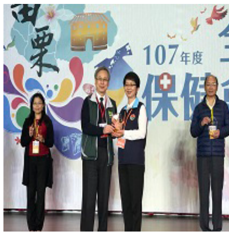
頒獎及表揚得獎者合影。