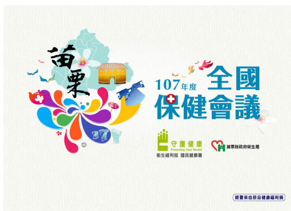
107 年度全國保健會議圖片。