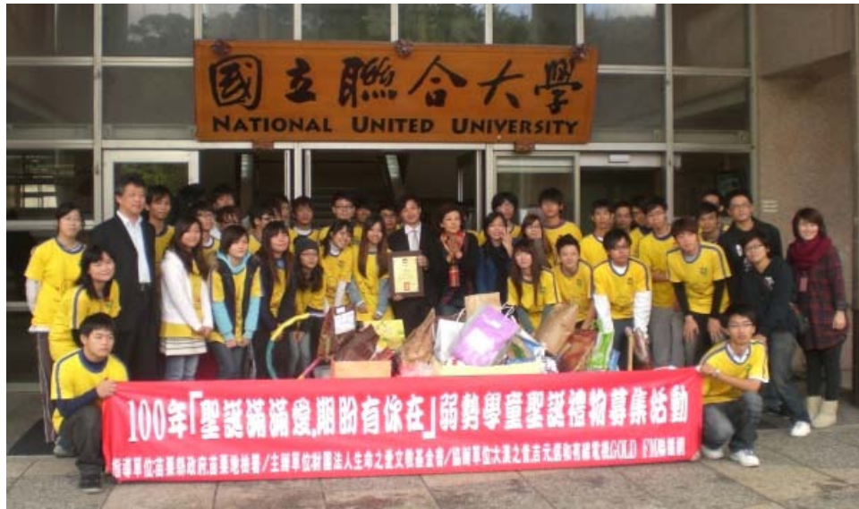
▲參加「聖誕滿滿愛期盼有你在」同學合影

語傳系李同學表示，看到小朋友們用注音寫的心願卡，覺得他們真的很可愛。希望他們也能在寒冬裡接收到我們傳送的溫暖。只要想到他們獲得禮物時的笑容，那麼這個禮物就非常有意義。