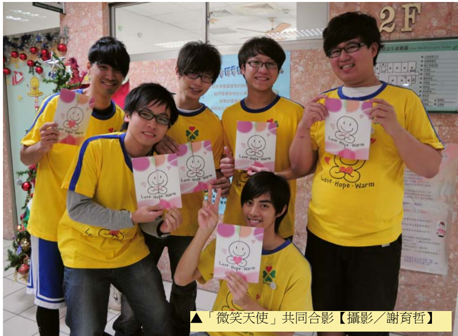
▲「微笑天使」共同合影

【記者／賴紀安 苗栗報導】國立聯合大學學務處，生涯發展與諮商輔導中心在十二月十九日到十二月二十三日，與聯合大學資源教室的守護天使志工團隊，舉行一連串聖誕節的相關活動，主題為愛在聖誕，童話人生。