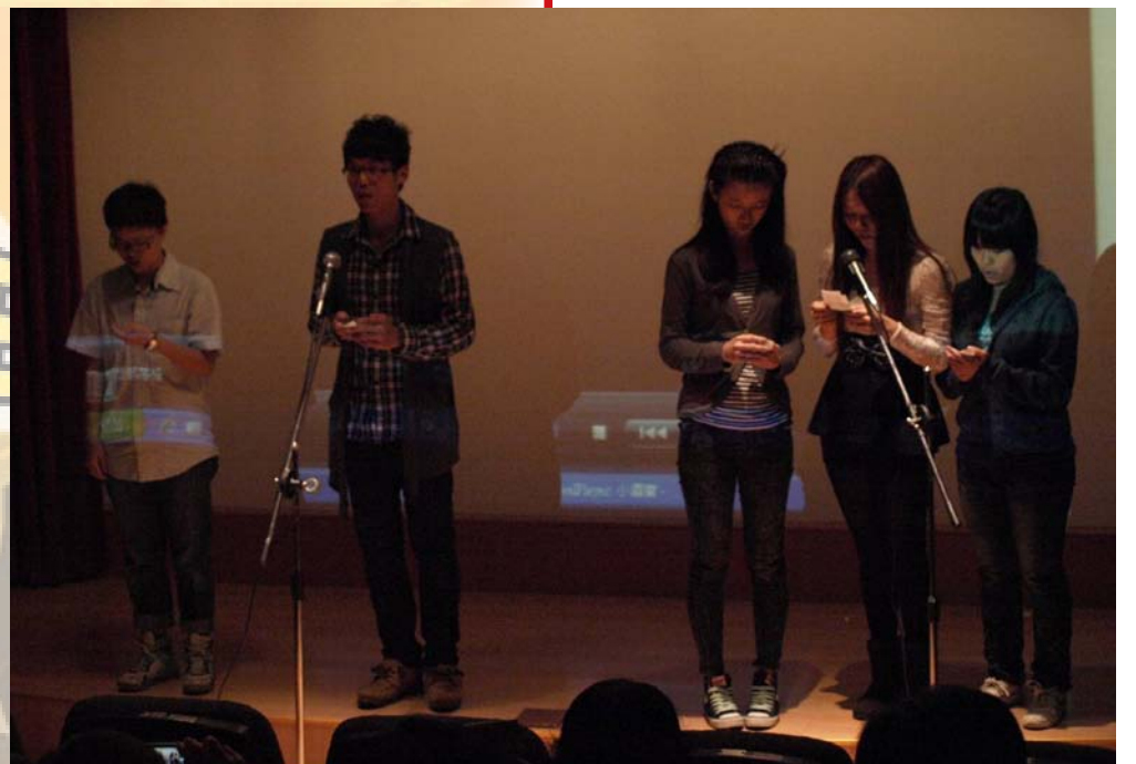
▲語傳系同學：夢想BLOG發表

孫主任最後補充說明，希望這項活動雖然在聯大是第一次，但是希望它不是最後一次，是不是最後一次就有賴於所有參與者是不是給予它更多的期待和參與。