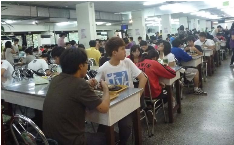
▲看似高朋滿座的學餐，銷售量卻不若以往【攝影／邱琬芳】

【記者／邱琬芳 苗栗報導】聯合大學逢中午時段，學生人潮蜂擁進入學生餐廳的畫面，是每個聯大生所不陌生。桌椅擺置限制下，學餐有限的空間被學生佔滿，可見各家大排長龍，不知隊伍尾端為何處。地板標註顏色箭頭，成了無用論，同學們只能順從人潮一波波的被推擠入內，讓中午學餐彷彿戰場般。