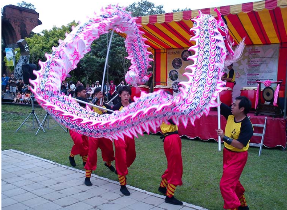
▲桐花祭開幕舞獅活動

平均約20分鐘一班車），再步行前往，沿途崎嶇的山路與豐富的生態，讓人彷彿置身在世外桃源之中，忘卻生活的繁忙與壓力。