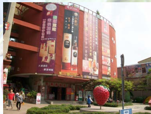
▲大湖酒莊

採完草莓的您，還可以去附近著名景點「大湖酒莊」，酒莊不只是酒廠而已，裡頭有介紹到草莓文化歷史背景外，更特別的是草莓製成品在這裡也應有盡有，包含草莓淡酒、草莓香腸、草莓冰淇淋、草莓蛋捲等伴手禮。來大湖遊玩您一定要來這，沒到這別說您來過大湖。