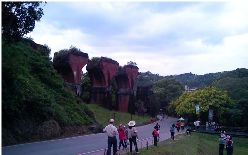
▲龍騰斷橋