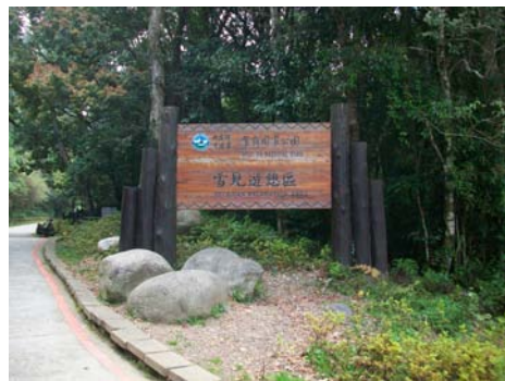
▲雪見入口看板