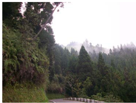
▲雪見雲霧繚繞的景色