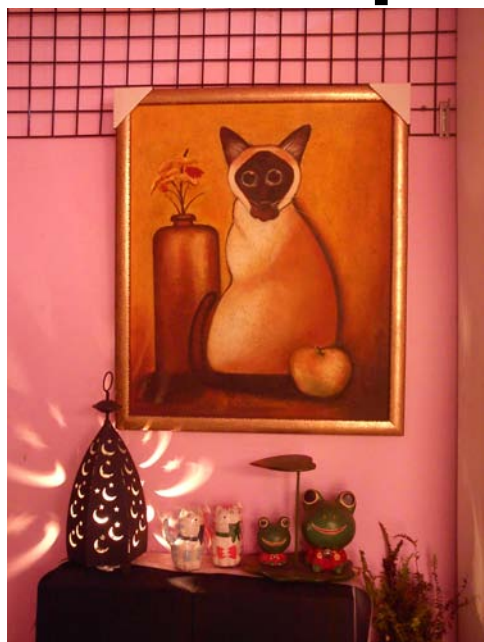
▲愛的幸福貓店內畫像

桐花祭成功帶動地方發展，帶來可觀的觀光收益，唯交通工具的規劃仍嫌不足，搭乘觀光巴士的民眾仍須步行數百公尺才可到達目的地。建議自己沒有交通工具的遊客，可以和其他人共乘計程車，4個人共乘至勝興，1個人費用約50多元。若是擁有駕照的旅客，可以在三義火車站前租摩托車，1天下來約300元。而想省錢的民眾可以穿適合登山的鞋子搭免費的觀光巴士（5月12、13日上午9點至下午17點30止，