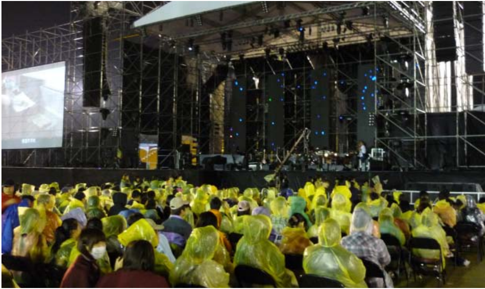
▲會場高朋滿座，即使下雨仍然魅力不減

活動當天雖然氣候不佳，但依然有不少民眾前去捧場，每個人穿著主辦單位提供的輕便雨衣，坐在雨中賞樂，別有一番風味。第一個開場的偶像團體棒棒糖男孩Lollipop F以勁歌熱舞帶動全場氣氛；接