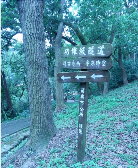
▲左圖位於貓狸山的功維敘隧道有立牌導引方向

功維敘隧道建於西元1902年，為台灣西部山線鐵路一環。然而在1998年改為雙軌，功維敘隧道因此走進歷史。苗栗市公所為了保存珍貴的鐵道文化資產，將功維敘隧道整理成一條結合自然生態與人文歷史的觀光隧道。隧道全長460公尺，在北方隧道口，可看見埋藏在草木中斑駁的「功維敘」三個大字，是由日據時代台灣總督兒玉源太郎，為了紀念興建隧道的有