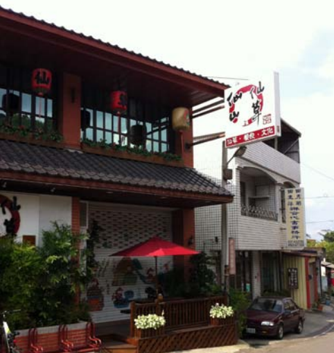
▲仙山仙草

吃，不過想不到仙草也可以這樣料理。建議您不妨走一趟獅潭仙山，品嚐消暑聖品仙草，體驗傳統與現代結合的料理美食，更別忘了帶份黑糖發糕回家細細品嚐客家米食的風味。