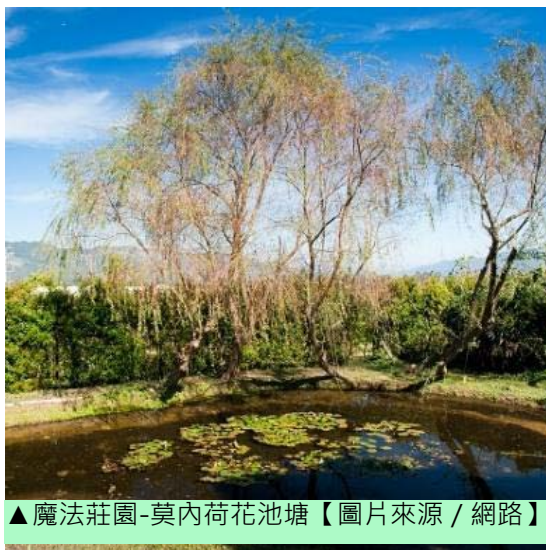
▲魔法莊園-莫內荷花池塘

苗栗縣卓蘭鎮西坪里的Vilavilla，「Vila」，意為斯拉夫童話中住在森林裡、溪流間、原野上的精靈。「Villa」為歐洲南部鄉村的花園住宅、古代的莊園，「Vilavilla」指的是充滿精靈和浪漫自然主義的魔法莊園。