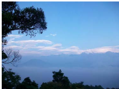
▲雪見美麗的雲海景色

們能有個增強體力的好地方。還等什麼？不要再宅在電腦桌前，和大自然來場午後邂逅吧！