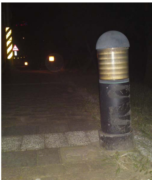
▲聯大路段路燈不亮，行車危險

另外，曾小姐也呼籲民眾，只要發現路燈壞掉，歡迎大家立即向市公所反應，市公所就會馬上派人去修繕，確保用路人的生命財產安全。