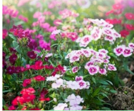
▲魔法莊園裏繁花盛開、爭奇鬥艷

置身在這片帶有北歐風格的莊園中，您將會發現莫內「睡蓮池上的橋」以及梵谷的「鳶尾花」、「橄欖樹」、「星夜」，兩位印象派大師的畫作與自然山林巧妙結合，不論家人朋友或是情侶都可到來這如詩畫般的地方。