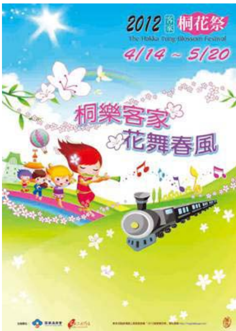
▲桐花季活動海報

（活動詳情請洽「2012客家桐花祭」主題網 http://tung.hakka.gov.tw/ ）