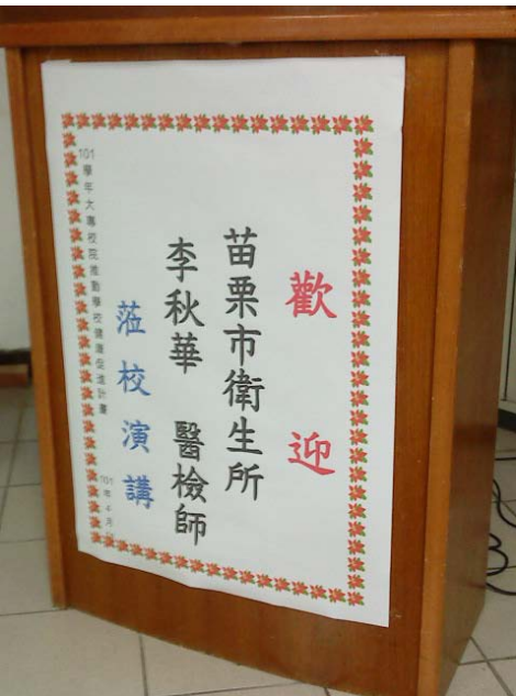
▲衛保教室講座