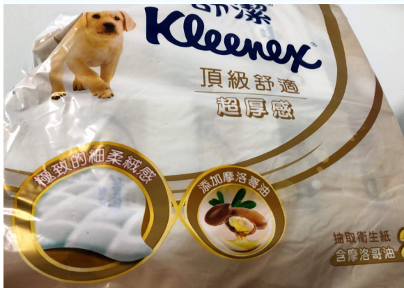
三月初國內掀起了一波搶購衛生紙風潮。

【記者許育豪報導】最近掀起了一波搶衛生紙的風潮，而人們幾乎無時無刻都需要用到衛生紙，這種囤積民生用品的行為對平時生活影響甚大。苗栗家樂福蕭姓員工表示自己是第一次看到這種情況，架上的衛生紙也都被搶的一件不剩，有時候都要趁公司補貨的時候自己先趕快買幾包，不然真的會沒衛生紙用。