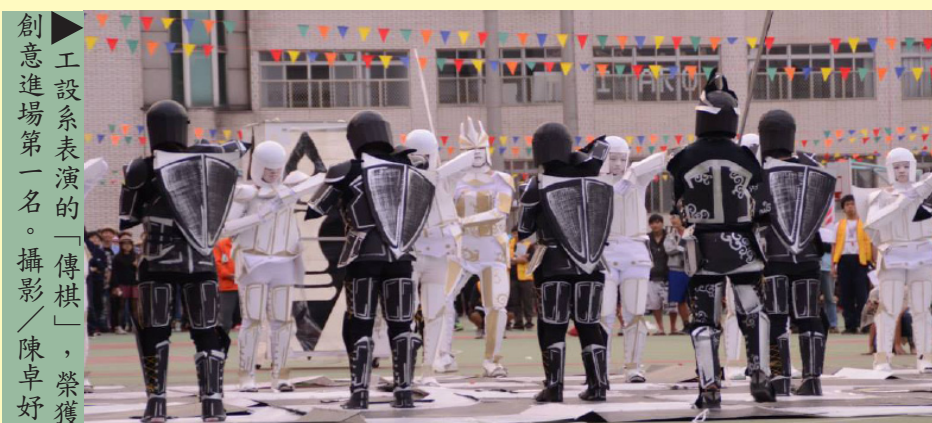
▲工設系表演的「傳棋」，榮獲創意進場第一名。

【記者徐清旆／苗栗報導】為期兩天的聯大41週年校慶熱鬧登場，由18個科系帶來的創意進場為聯大校慶揭開序幕，各個科系都展現出最有活力的一面，揮灑汗水、面帶笑容一同參與這個盛舉。