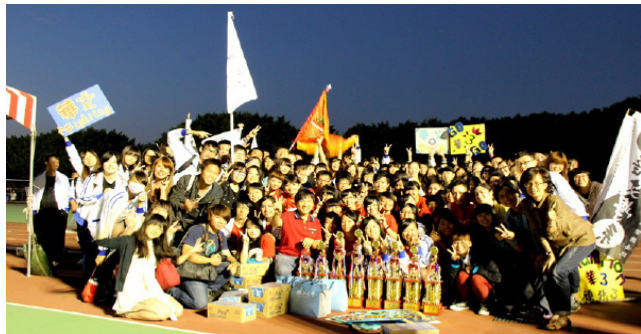
▲華文系榮獲精神總錦標第一名，大家開心合照。

說象徵團結、一個向心力的表現，因此精神總錦標對華文系很重要。因為華文系男生較少，大隊接力需要女生下去幫忙，幸好女生也很願意。這代表華文系的同學不只有一個人，而是有整個系的夥伴支持著。精神總錦標能夠使華文系的師生上下團結一心，也希望明年能夠繼續奪得。