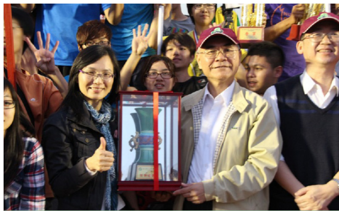
▲光電系榮獲團體總錦標。

苗栗國立聯合大學41週年校慶活動於11月22、23日登場，令人矚目的除了啦啦隊以及創意進場冠軍爭奪戰之外，團體總錦標、精神總錦標、競賽總錦標也被全校同學視為最高榮譽代表。