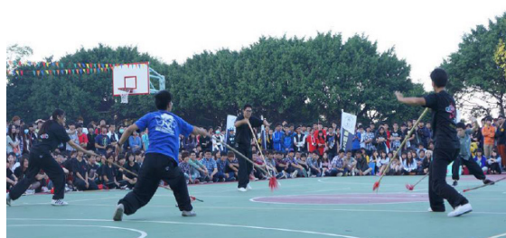
▲國術社生動活潑的表演帶領所有師生進入武術世界。

第二天的閉幕表演則以國術社和熱舞社壓軸。國術社這次主題為神奇寶貝、女朋友被搶之復仇；跟創意啦啦有些雷同，融合了多種元素並擁有劇情，令人眼睛為之一亮，觀