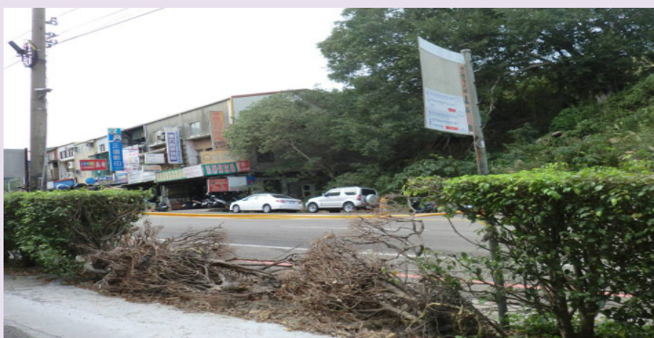
▲往第一停車場機車道旁的圍籬有約兩公尺長的樹枝叢堆，增加行車危險。

【記者陳冠如／苗栗報導】不知道您有發現嗎？國立聯合大學校門口右側原本茂密整齊的圍籬小樹，竟倒了約兩公尺，讓原本平穩的機車道，出現了一個大缺口，使行經此處的車輛，增加不少危險。