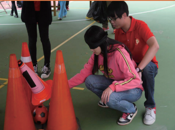
圖左為紅柿傳情結合之社團成果動態展，圖右則為紅柿傳情今世相遇闖關活動之實況。