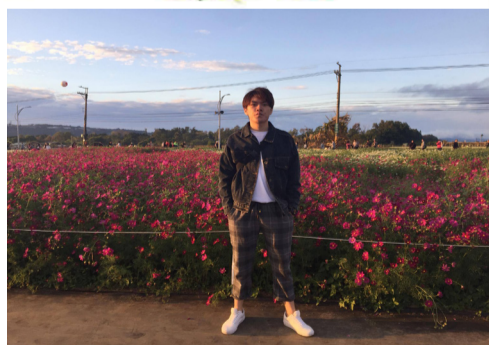
粉色花海讓遊客都搶著拍照留念。

在資訊發達的現在，花海也有官方網站，詳細的記載了所有花的盛花期，在出發前可以先上網查詢現在是甚麼花的開花期，新社花海的開放時間是 11 月 11 日至 11 月 26 日，今年的時間已經過了，但不用擔心中社花海是全年無休的喔！快找時間和親朋好友一起去賞賞花吧！