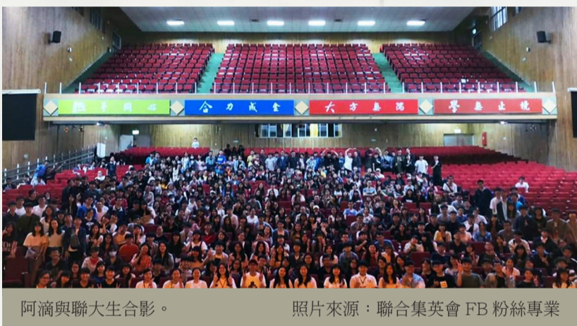
阿滴與聯大生合影。

阿滴英文創立的初衷是，以一支支的影片，引發大家對英文的興趣。結合大學所學的多媒體及英文教育，2015年1月在YouTube上傳了第一支影片。阿滴：