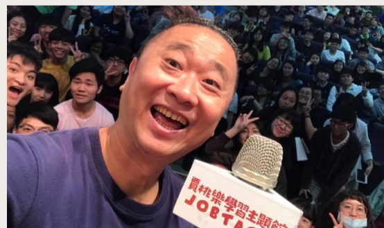
邵智源與台下同學大合影。

最後Q&A階段，提問同學們從研究所選擇原因及生涯規劃，廣至新舊媒體差異上的想法與邵智源做話題交流，其中對於未來新鮮人的出路方向，邵智源給了兩個建議，一是給自己2到5年的時間去嘗試，但不要離開自己的專業領域太遠；二是進入社會後，還是以經濟條件做取捨，興趣若賺不到錢，只會棄之如敝屣，並以一句其在演藝圈堅持的理念：「這件事的價值，不要以金錢衡量，而是要以prize中的附加價值去定義」與同學共勉之。