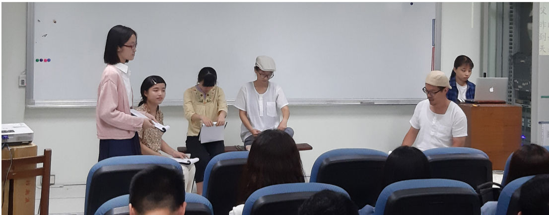
女主角在台上演出的過程。